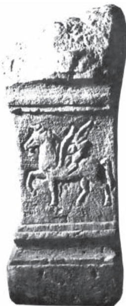
Rimska ara iz Stare Pazove

In the village area the coins of the city of Apollonia and a hoard containing 86 pieces of Roman copper imperial coins datable to the 4 th century were accidentally discovered. Large amounts of building rubble, the remains of building foundations, fragments of pottery and metal objects were unearthed during deep ploughing on a farming estate “Janko Čmelnik”, attesting to the existence of a settlement and a necropolis. A votive altar mentioning Aurelius Super, the veteran of the legion II Adiutrix , was found here as well.