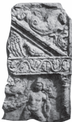
Deo rimskog nadgrobnog spomenika iz Golubinaca

Coinage of Apollonia and Roman tombstones with figural ornaments were found by chance in the area of the village.