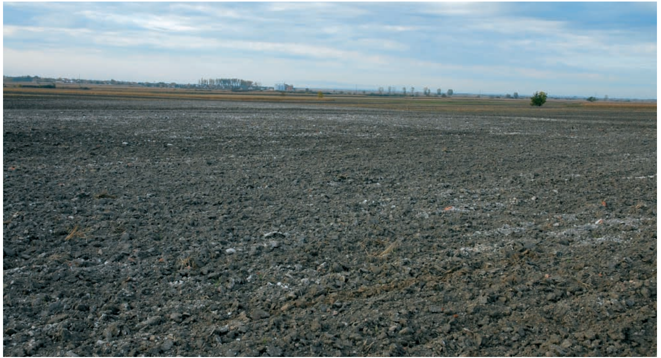
Ostaci građevinskog šuta po površini oranica na nalazištu „Solnok“ u Dobrincima

The remains of builder's rubble on the surface of fields at the site "Solnok" in Dobrinici